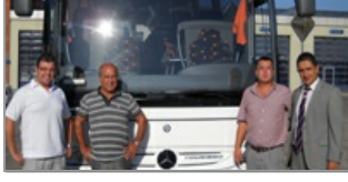
Kardeşler Turismo'yu tercih etti